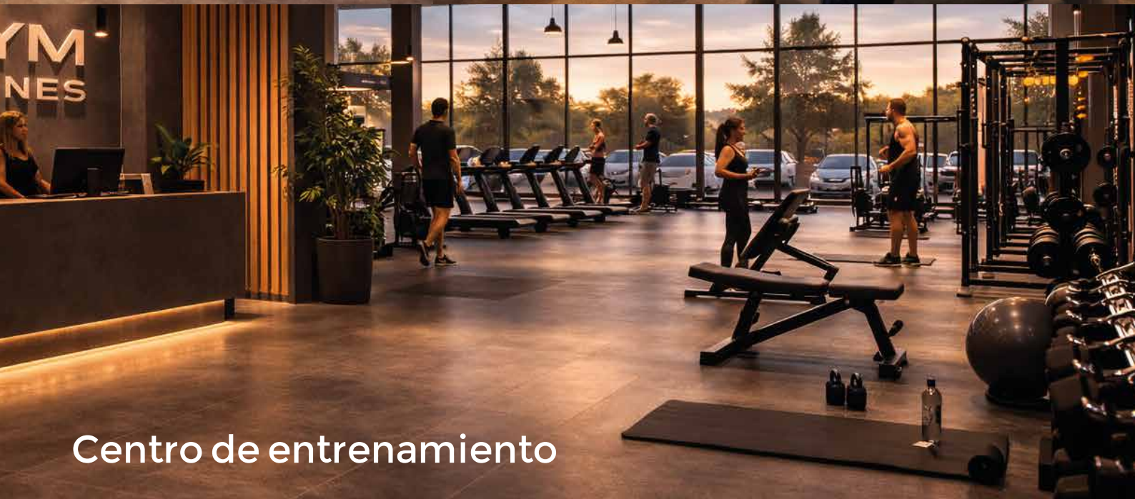
Centro de entrenamiento