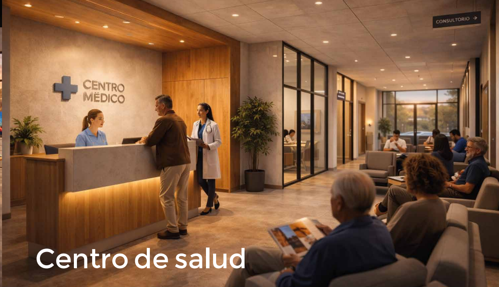
Centro de salud